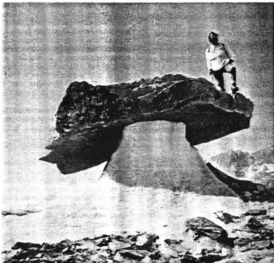
Fig. 4. - Une «table glaciaire», telle que la représente, en page 301, le numéro 12/89 d'Ingénieurs et architectes suisses.

d'inertie pourrait être peu à peu mieux prise en compte. J'en citerai un signe caractéristique: dans les cahiers Élé-ment de l'Industrie suisse de la terre cuite on peut lire: «[...] de très faibles valeurs du coefficient k ne procurent aucun avantage, dans le cas de murs massifs» [3].